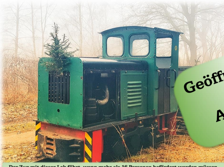
Der Zug mit dieser Lok fährt, wenn mehr als 16 Personen befördert werden müssen.

Geöffnet: Sonntag 10- 16 Uhr 1. + 2. + 3. Advent Abfahrt ca. alle 3/4 Stunde (Änderungen vorbehalten!)